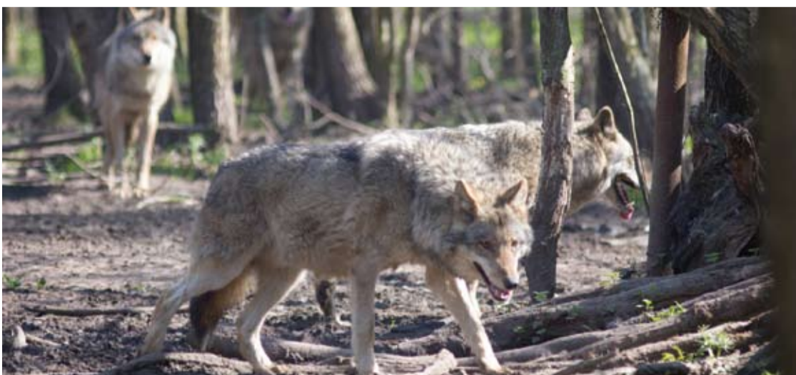
Pernai Anykščių rajone sumedžiotas rekordinis kiekis vilkų. Net dvylika.