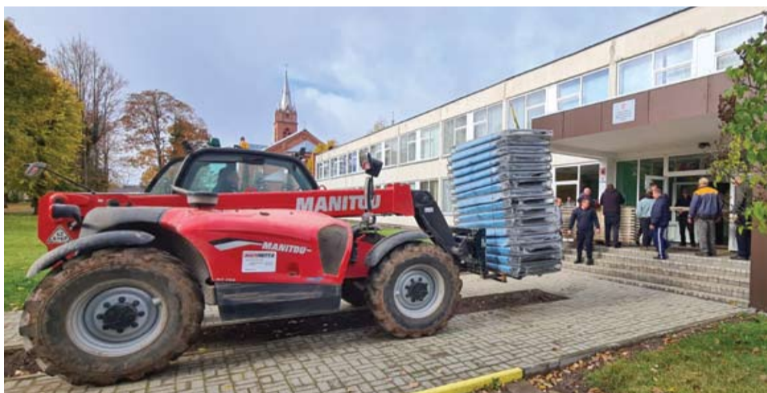
Trečiadienį į buvusios Viešintų mokyklos pastatą pradėti gabenti baldai.

Spalio 12-ąją, trečiadienį, į buvusios Viešintų mokyklos pastatą gabentos lovos. Patalpos ruošiamos pabėgėliams iš Ukrainos žiemoti. Lovos montuojamos ir statomos buvusios mokyklos klasėse. Ant kiekvienos klasės ir kabineto durų pakabinti lapeliai su dviem skaičiais, kurie nurodo optimalų ir maksimalų lovų kiekį patalpoje.