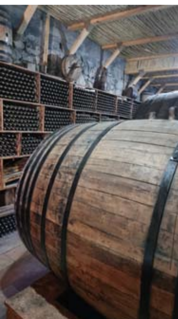
Areni kaimas laikomas Armėnijos vyndarystės centru. Kaime yra kelios vynu gamybos įmonės.