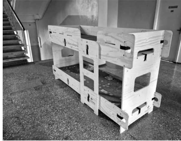
Viešintų mokyklos gyventojų skaičius, tikėtina, priklausys nuo situacijos Ukrainoje. Mokykloje pastatytos ir vaikiškos lovelės.