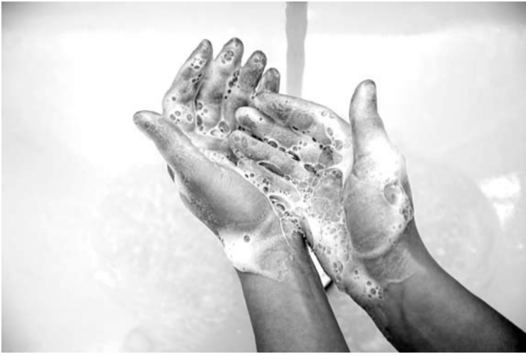
Prasidėjus šaltajam sezonui ypač svarbu laikytis prevencinių ir apsaugos priemonių.

Vasaros metu daugelis buvo labiau atsipalaidavę, tačiau prasidėjus šaltajam sezonui ypač svarbu būti socialiai atsakingiems ir laikytis prevencinių ir apsaugos priemonių, padedančių apsisaugoti nuo klatingos COVID-19 infekcijos.