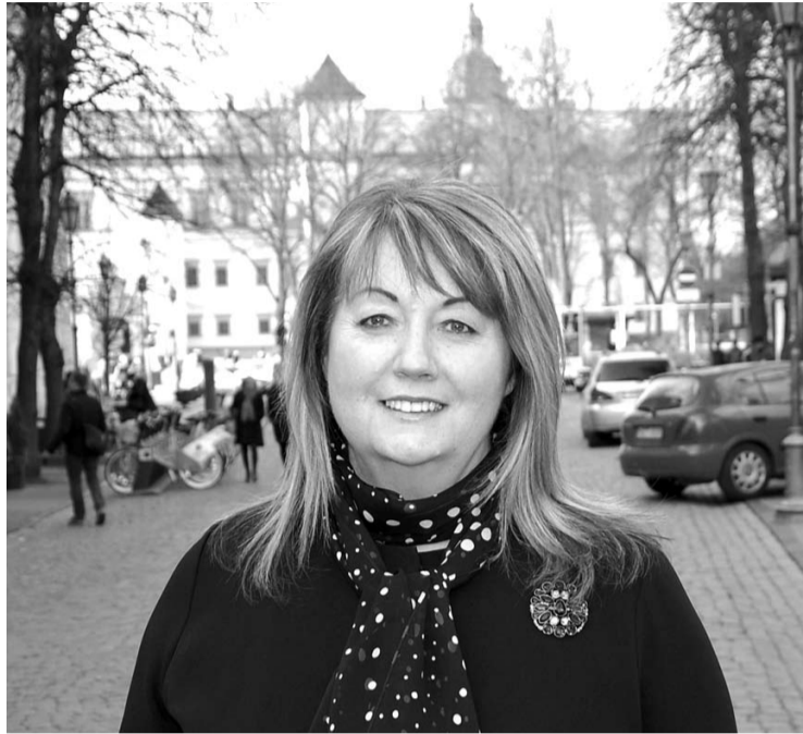
Vilija Blinkevičiūtė: „Ši krizė turi būti solidarumo, naštos ir milžiniškų pelnų dalijimosi su visais laikas.“

Europos Parlamento socialdemokratai siūlė išskirti maisto gamybos sektorių, šiam sektoriui taikyti išskirtines kainų „lubas“, kad būtų išvengta itin spartaus maisto kainų didėjimo.