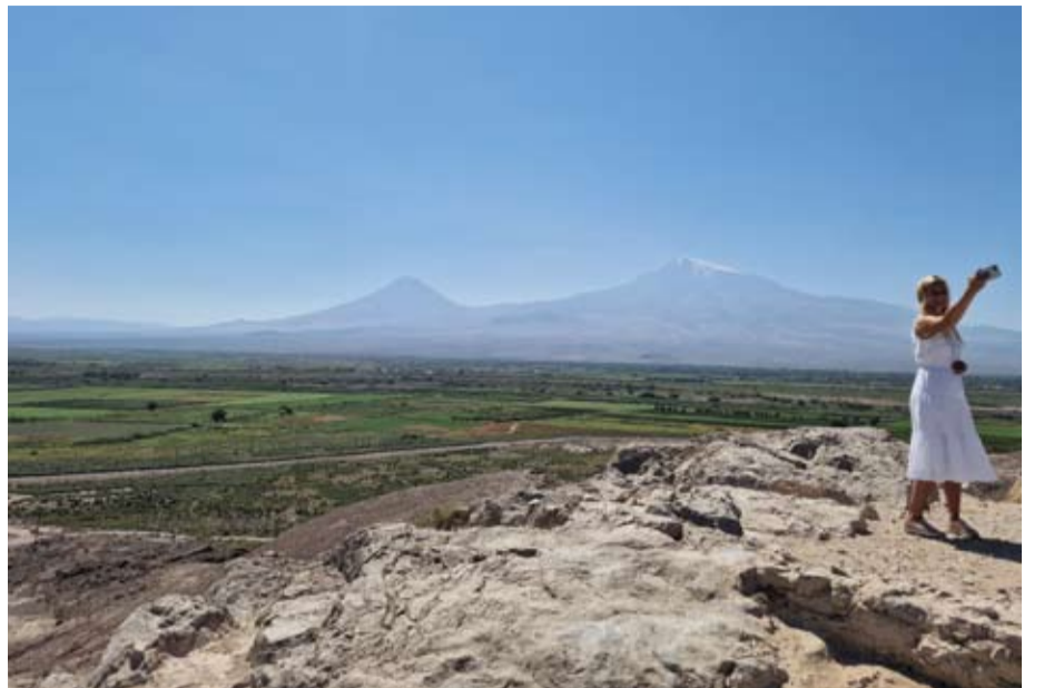
Khor Virap vienuolynas, įkurtas VII amžiuje.

(Tęsinys. Pradžia – „Anykšta“ Nr. 72, 2022-09-17)